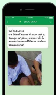
ครูประจำชั้น/ครูพยาบาล