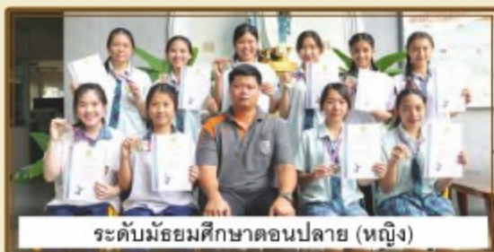
ระดับมัธยมศึกษาตอนปลาย (หญิง)