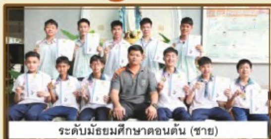
ระดับมัธยมศึกษาตอนต้น (ชาย)

ทีมนักกีฬาวาสเกตบอล ได้รับรางวัลชนะเลิศ 4 รางวัล