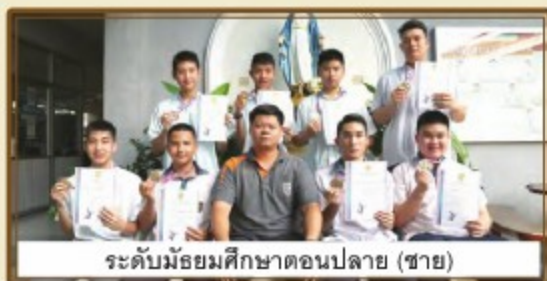
ระดับมัธยมศึกษาตอนปลาย (ชาย)