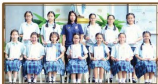
ทีมนักกีฬาแชร์บอล ได้รับรางวัลชนะเลิศ ระดับประถมศึกษาตอนปลาย (หญิง)