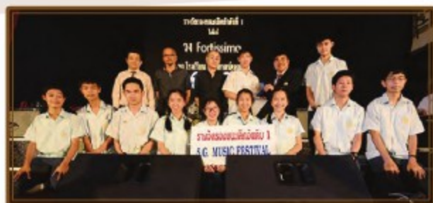
วง Fortissimo ได้รับรางวัลรองชนะเลิศอันดับ 1 ประเภทวงสตริง Combo Band Competition 2016 เมื่อวันที่ 22 สิงหาคม 2559