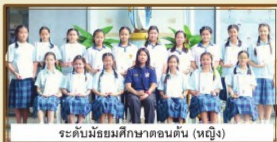
ระดับมัธยมศึกษาตอนต้น (หญิง)