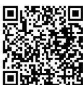
ใบคำร้องค่าธรรมเนียม

หมายเหตุ : ทางโรงเรียนมีช่องทางการชำระเงินทั้งแบบมาชำระที่แผนกธุรการ และส่งหลักฐานทาง Online รายละเอียดวิธีการชำระเงินในรูปแบบต่างๆ กรุณาสแกน QR Code (ช่องทางการชำระเงิน)