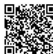
ช่องทางการชำระเงิน