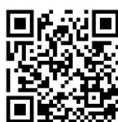
แบบฟอร์มแจ้งการโอน